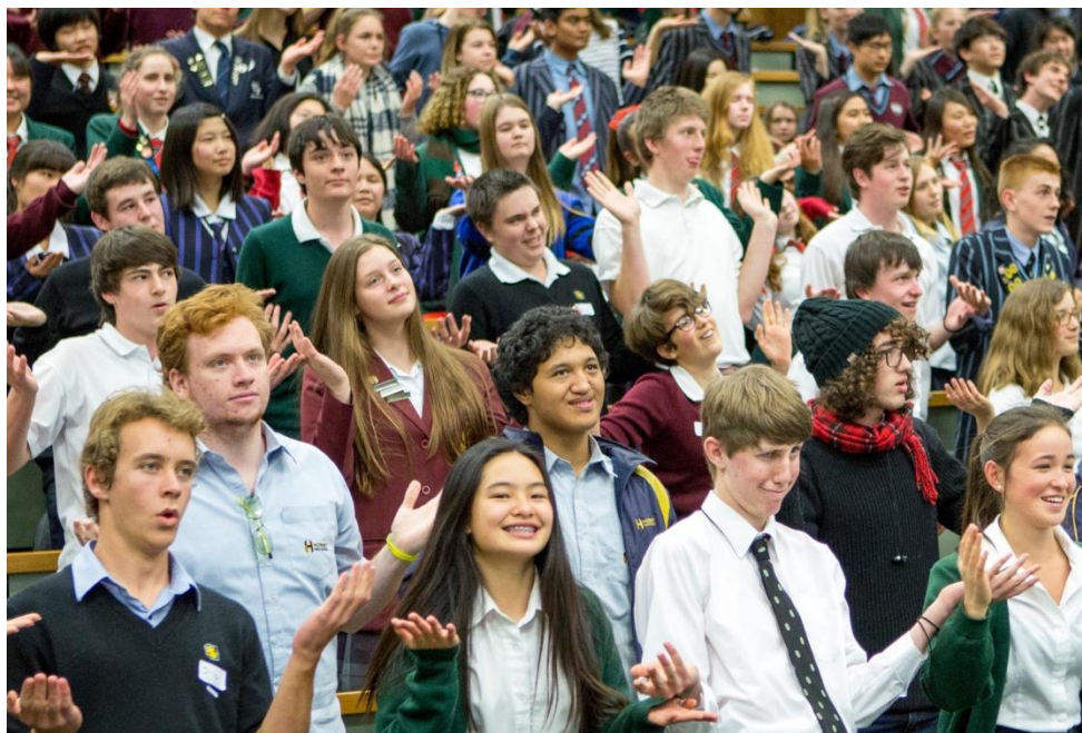
「おどるポンポコリン」を踊るクライストチャーチの高校生