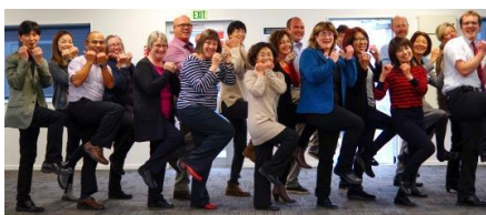
クライストチャーチの高校と大学の先生たちも踊りました！