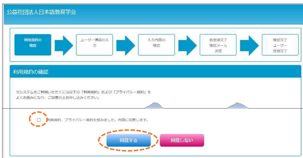
図2 利用規約の確認画面

2. 利用規約の確認画面(図 2)の利用規約とプライバシー規約を読み、同意頂けましたら、ページ下部のチェックボックスにチェックを入れ、「同意する」をクリックしてください。